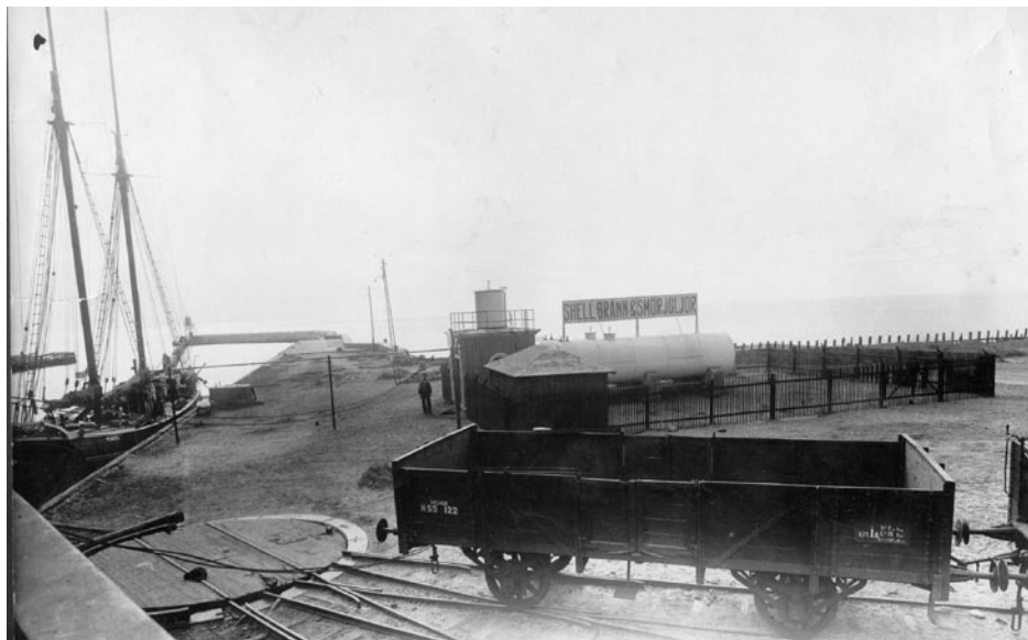
En av vändskivorna för järnvägsvagnar vid den så kallade Exportkajen.

ket hämtades dit. Men ännu i många år skulle Råå Hamn spela en aktiv och viktig roll som både utskeppnings- och mottagningshamn.