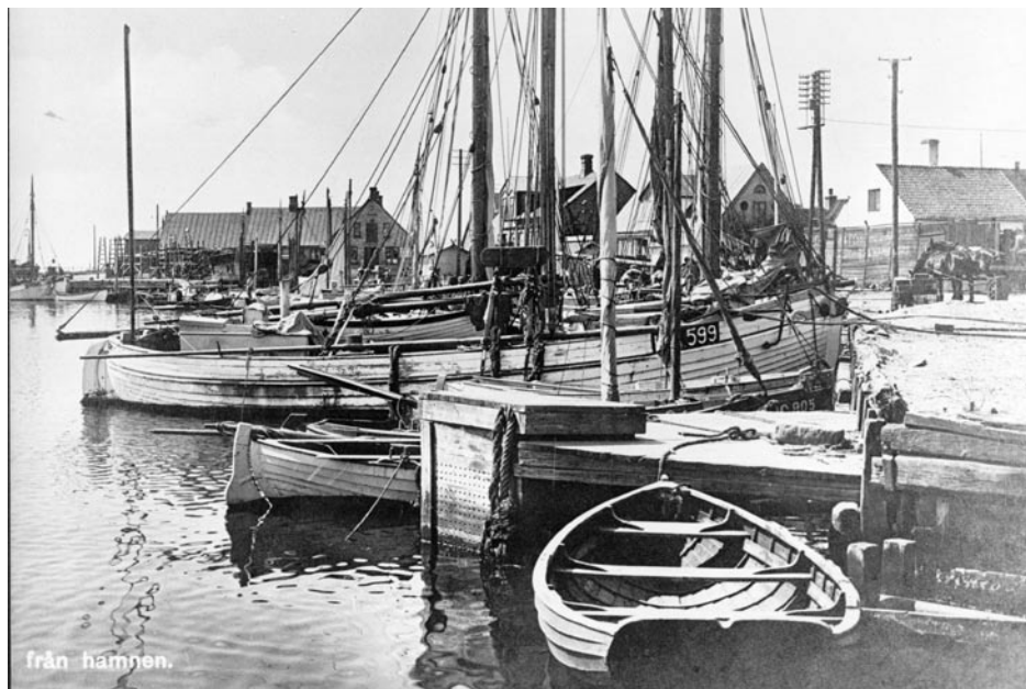
Fiskekajen ca 1920. Bakom hästarna th ser man Cindersfabrikens "kålagår".

Vi kliver in i tidsmaskinen och förflyttar oss cirka hundra år bakåt i tiden. Platsen är Råå Hamn och här råder liv och rörelse från morgon till kväll. Vid Snedkajen och Handelskajen trängs segelfartyg med ångfartyg, alla väntar på lossning och lastning. Längre in i hamnen vid Fiskekajen samsas kvassar med mindre båtar, det är bråttom, natten fångst ska snabbt iväg.