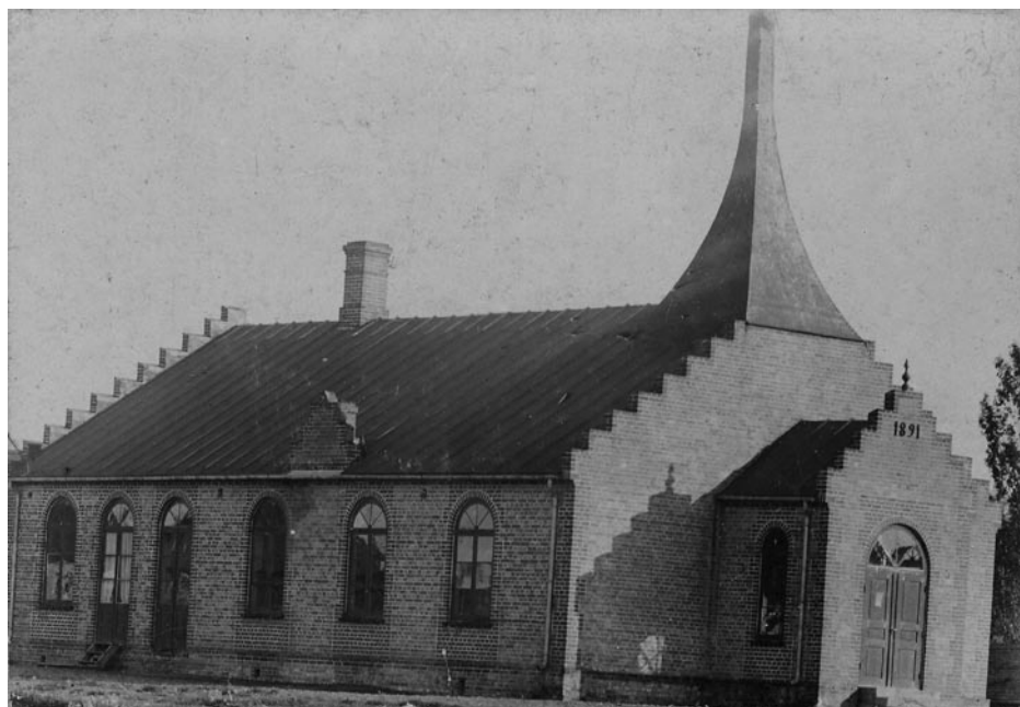
Emanuelskyrkan, kapellet kallat, i sitt ursprungsutförande 1891. Så hade även metodisterna fått "eget hus".

något annorlunda tolkning av det kristna budskapet.