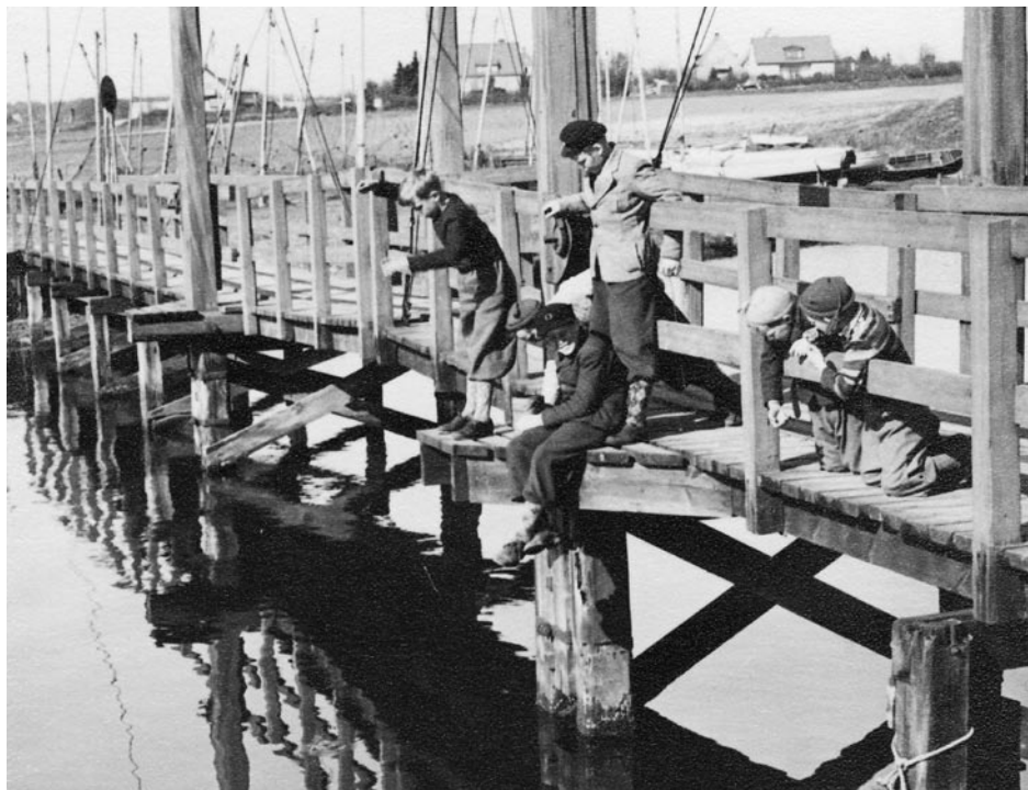
Gamla träbron var en populär plats för metande Rååpojkar.