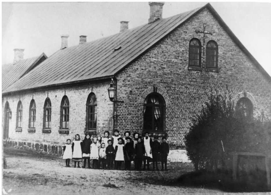
Betelkyrkan vid Styrmansgatan invigdes 1885. Söndagsskolan samlade många barn, här en grupp från ca 1910-1915.