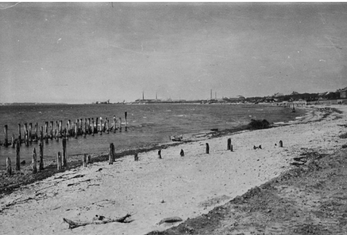
Suran norr om piren. På bilden finns fortfarande lite av träpalissaden kvar.

Vi måste ta en sväng ner om Suran, eller rättare sagt de sorgliga resterna av denna favoritlekplats. Suran byggdes upp som skydd mot stormarnas förödande framfart 1892 och tio år senare när den kraftfulla så kallade julstormen härjade längs våra kuster fick de grova timmerstockarna och stadiga stenblocken utanför palissaden bevisa sin styrka.