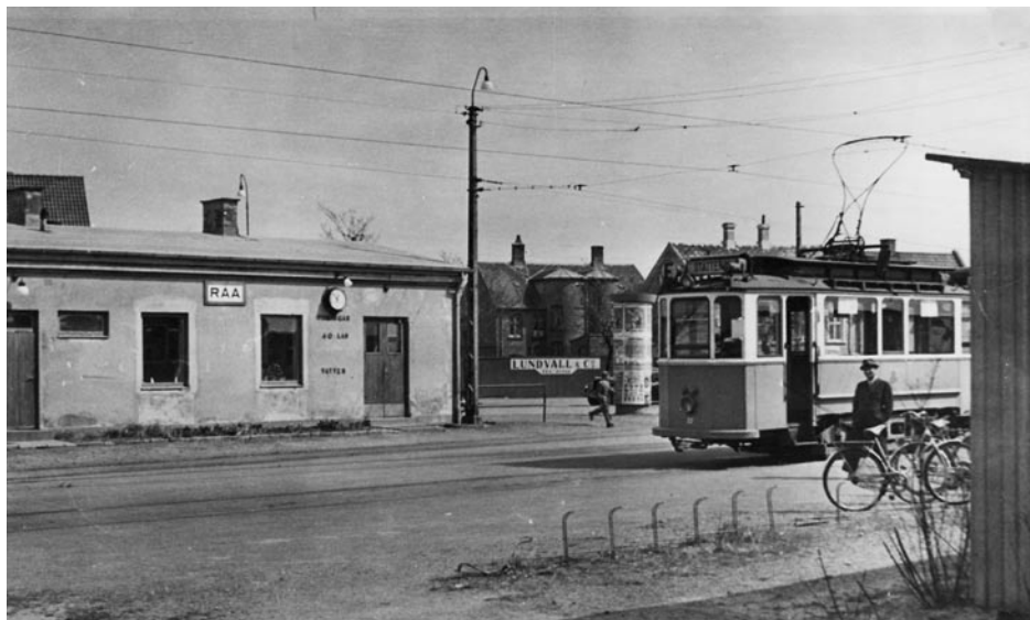
Spårvagnen till stan vid Råå Södra.

Söder om skolan fanns Råå Station! Minns någon den? Station, lok- och vagnsfall byggdes ursprungligen för den