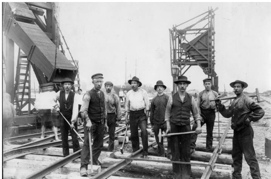
Järnvägsspår läggs till de nyuppförda kranarna omkring 1903. Kopparverkets loss- ningsapparater är redan på plats.

Kopparverkets storhetstid i Råå Hamn varade drygt femton år. Den egna hamnen var färdig att tas i bruk 1916, och utrust- ningen, som var specialutformad för Ver-