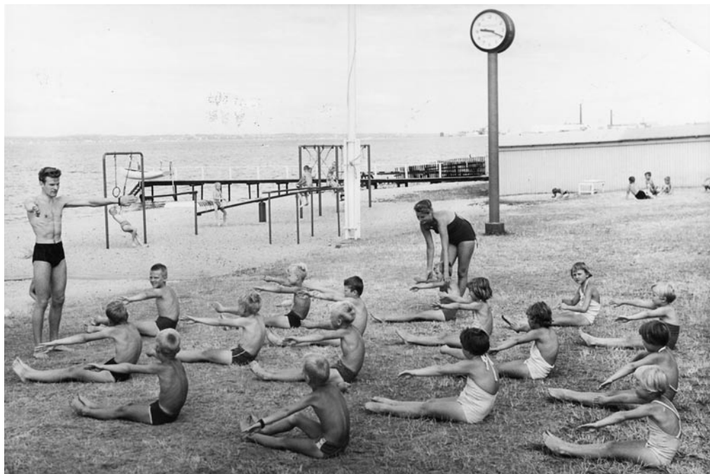
Torrsim var ett måste innan vattenlektionen kunde börja. Vem är simläraren, någon som vet?

Den fina stranden och det svalkande havet lockar från tidig vår entusiastiska soldyrkare och badare. Flygsanden är mera markant här än längre norr ut och sträv, vassliktade grönska av samma typ som finns söder om Småbåthamnen tar över som vegetation.