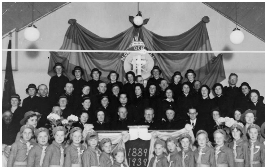
Det var många medlemmar som firade Råå Frälsningsarmékårs 50-års jubileum 1939. Bland flickorna känner vi igen åtskilliga Råådamer.