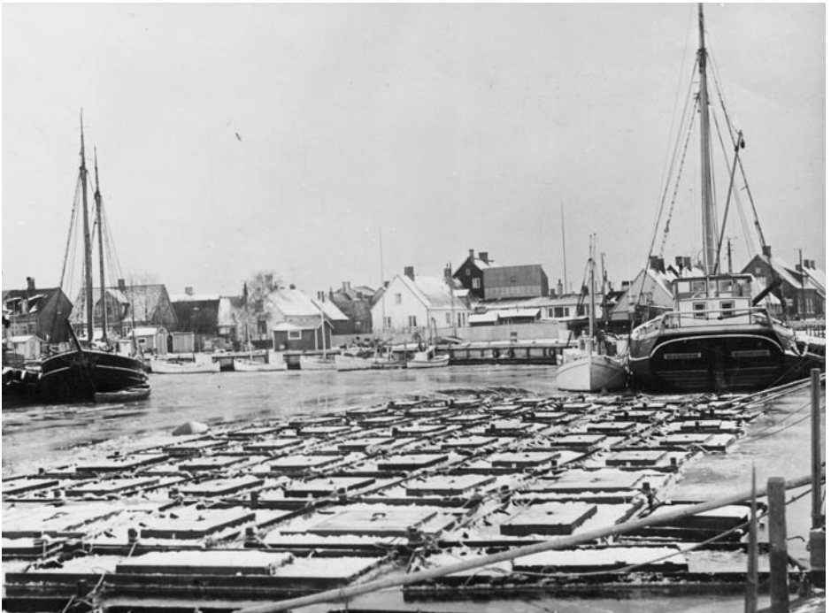
Vinterliggare och ålhyttefat satte sin prägel på hamnen under många vintrar.