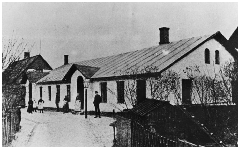
Det så kallade Gamla Missionshuset byggdes 1870.

Evangeliska Fosterlandsstiftelsen (EFS), Svenska Missionsförbundet (SMF), Metodistkyrkan i Sverige och Frälsningsarmén, är alla väl kända och på Råå etablerade Frikyrkoförsamlingar, vilka har spelat och spelar viktiga roller i vårt samhälle.